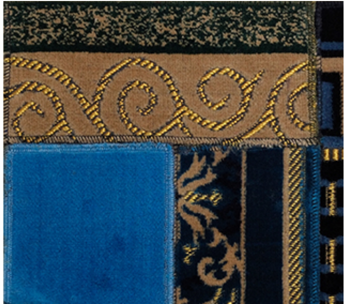
2023-2024, collage with prayer rugs, 30 x 30 cm.