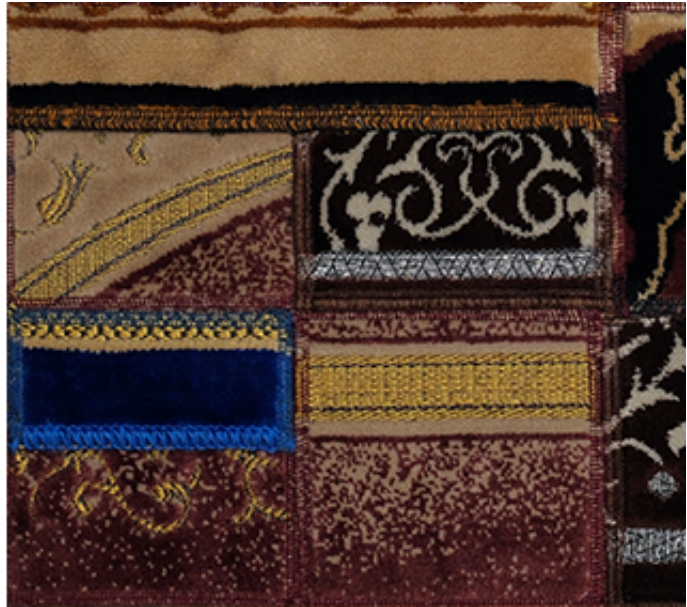
2023-2024, collage with prayer rugs, 30 x 30 cm.