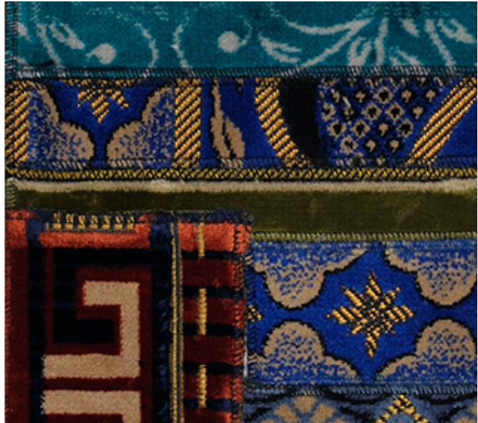
2023-2024, collage with prayer rugs, 30 x 30 cm.