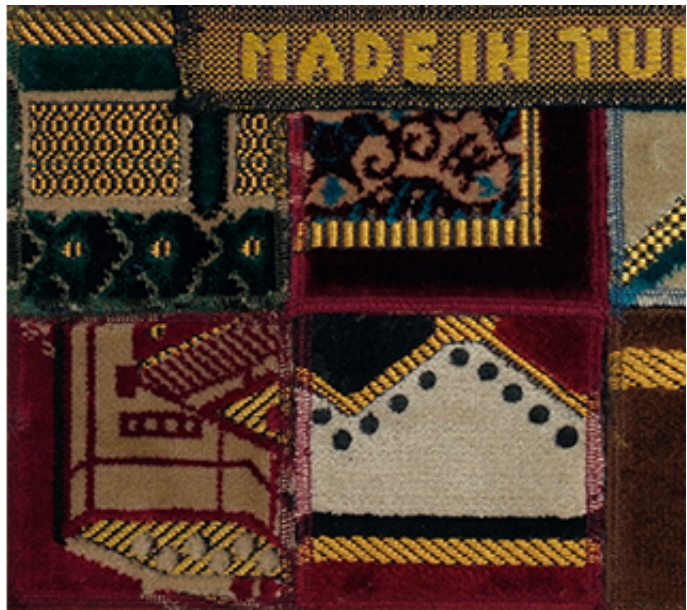
2023-2024, collage with prayer rugs, 30 x 30 cm.