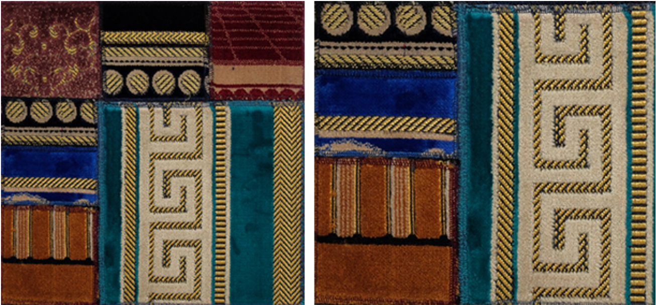
2023-2024, collage with prayer rugs, 30 x 30 cm Courtesy of the artist.