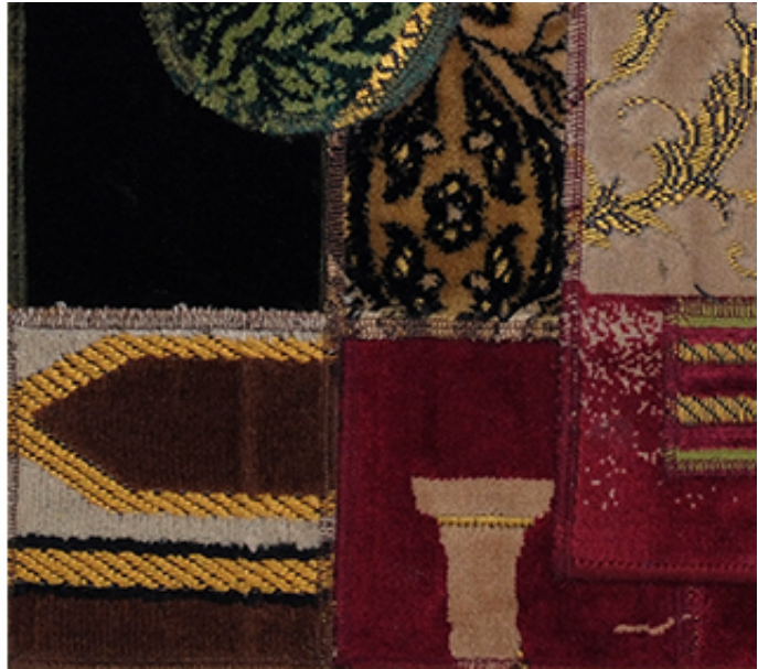
2023-2024, collage with prayer rugs, 30 x 30 cm.