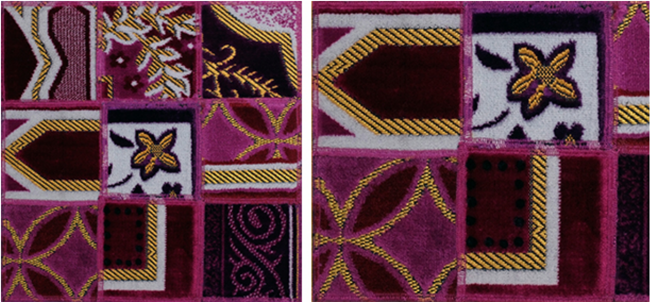
2023-2024, collage with prayer rugs, 30 x 30 cm. Courtesy of the artist.