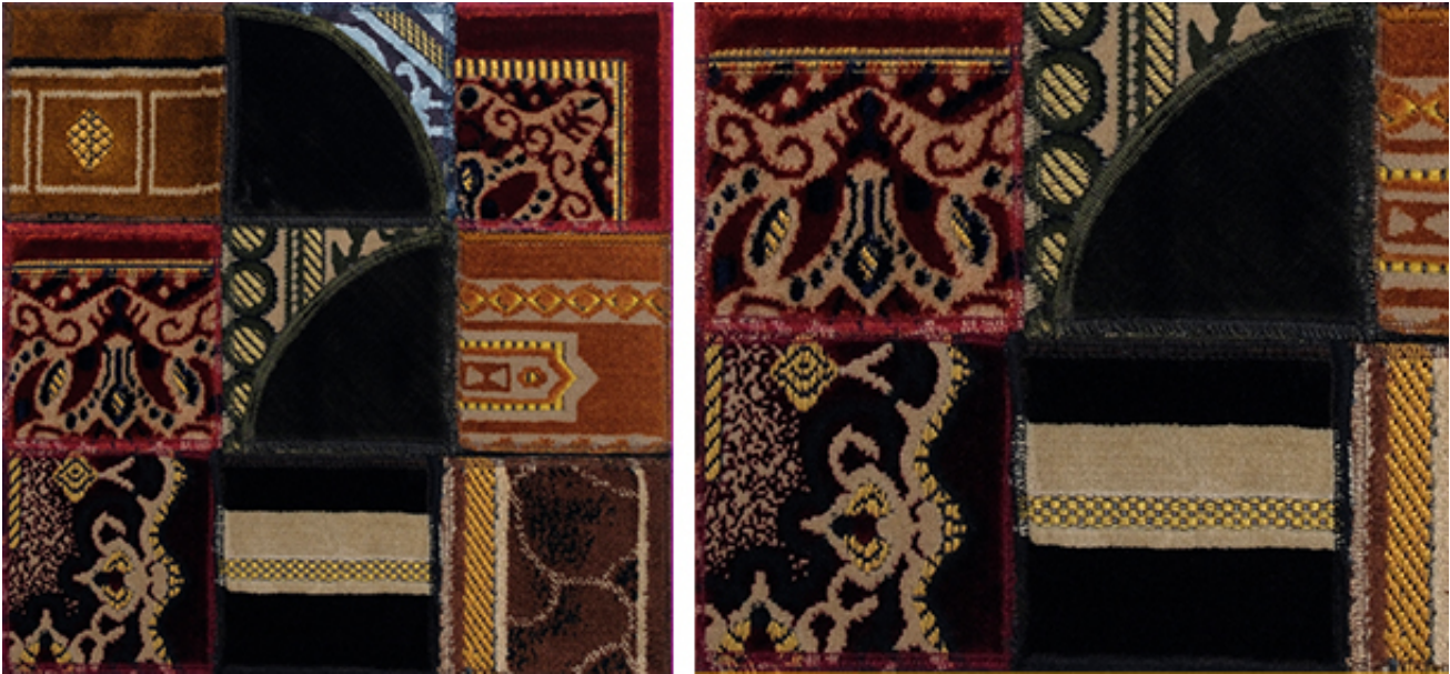
2023-2024, collage with prayer rugs, 30 x 30 cm.