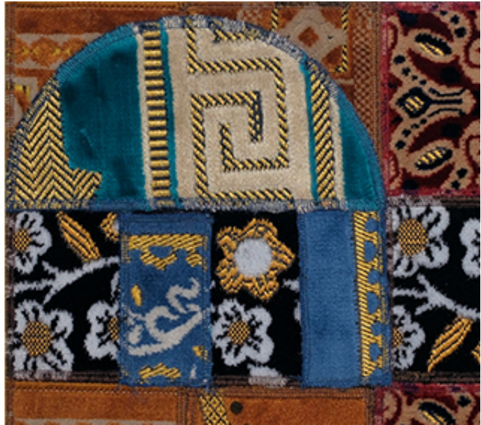
2023-2024, collage with prayer rugs, 30 x 30 cm. Courtesy of the artist.