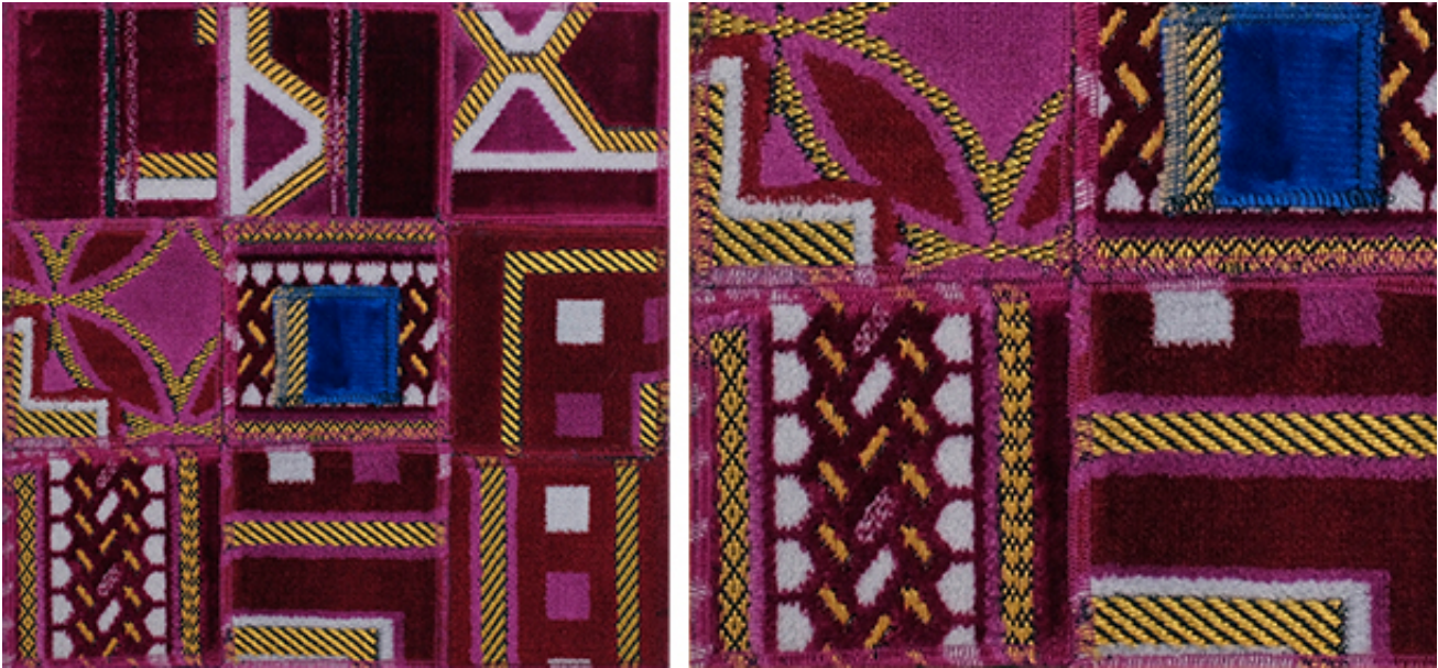
2023-2024, collage with prayer rugs, 30 x 30 cm.

En 2011, mounir fatmi a commencé à travailler sur une série de collages intitulés Labyrinthe , composés en utilisant des morceaux découpés de tapis de prière islamiques. Au sein des six collages qui forment cette série non achevée, on trouve une esthétique architecturale forte, avec des éléments évoquant des frontons, colonnes, plans et ornements, et pourtant chaque œuvre est visuellement très distincte des autres.