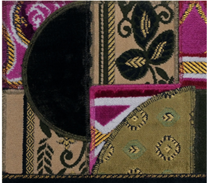
2023-2024, collage with prayer rugs, 30 x 30 cm.