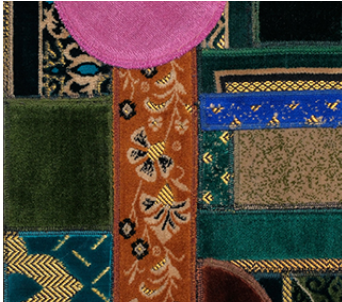
2023-2024, collage with prayer rugs, 50 x 50 cm. Courtesy of the artist.