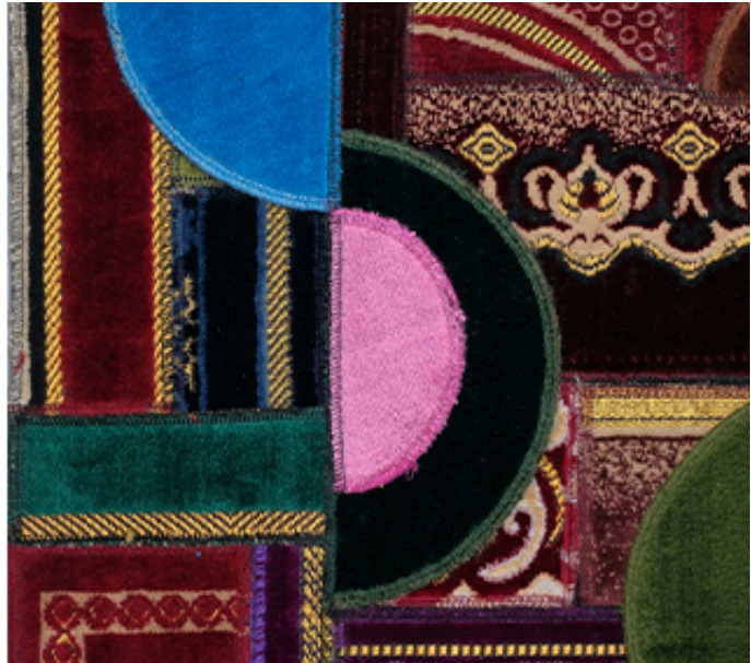
2023-2024, collage with prayer rugs, 50 x 50 cm. Courtesy of the artist.