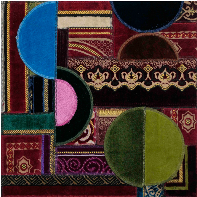
Sonia Sonia Sonia

In Sonia, Sonia, Sonia, the use of prayer rugs is deliberate. First of all it's an unusual material from which to create such a large collage, but rather than use any old carpets, these are specifically prayer rugs, therefore a desacralization of an object typically used in communion with god. The value of the rug as a religious object is gone, but its value as a work of art has emerged.