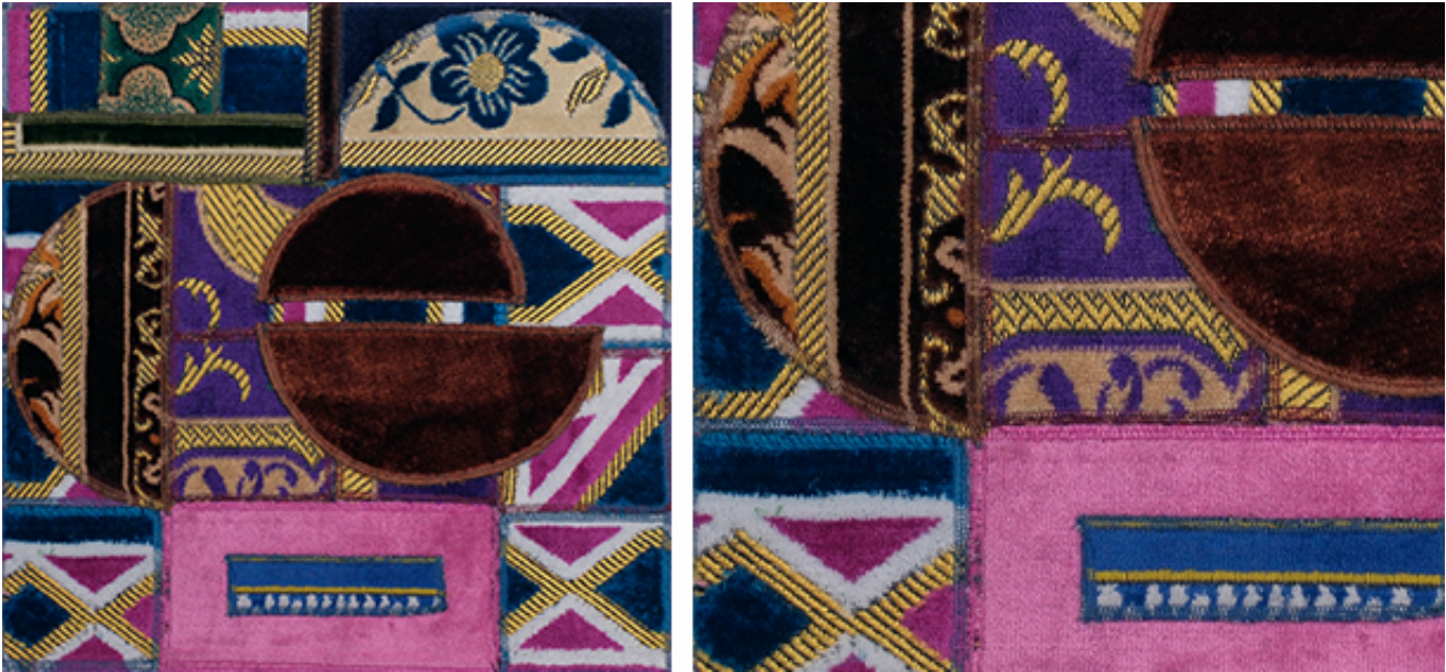
2023-2024, collage with prayer rugs, 40 x 40 cm. Courtesy of the artist.