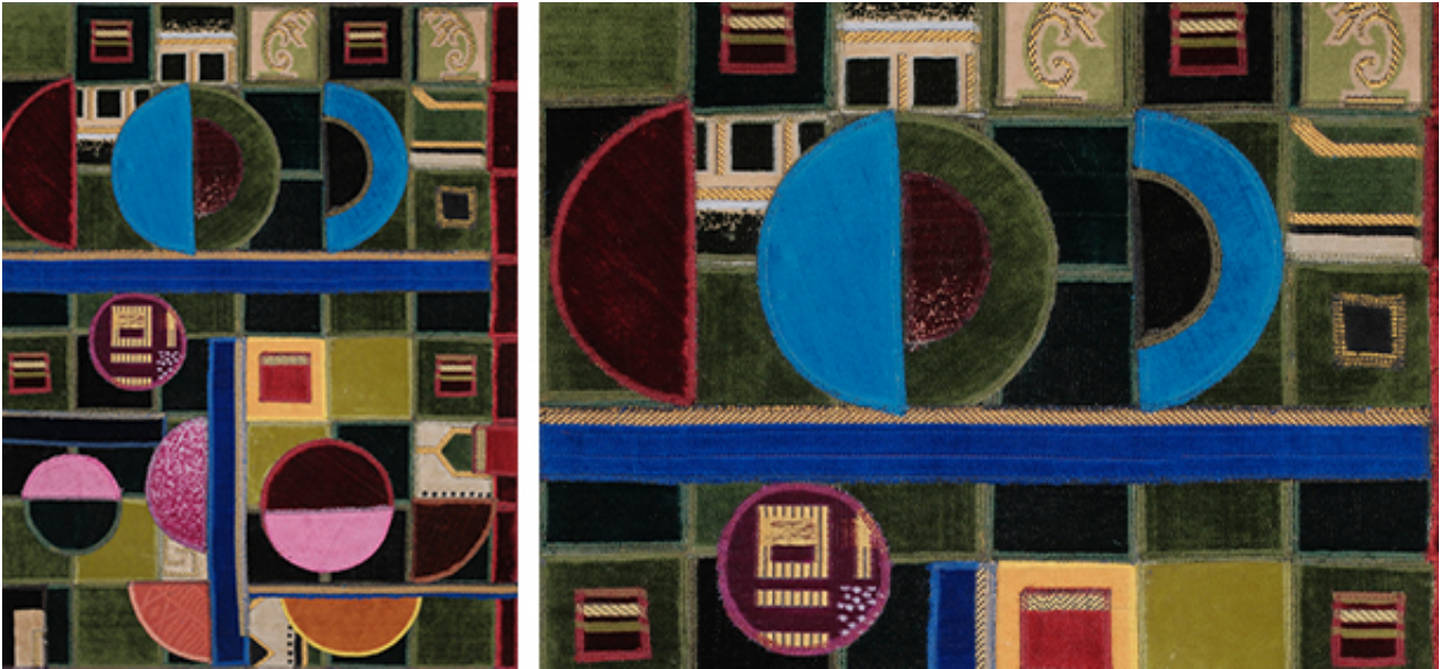
2023-2024, collage with prayer rugs, 65 x 81 cm. Courtesy of the artist.

Il aura fallu plus de 100 tapis de cent de couleurs et motifs différents pour créer Sonia, Sonia, Sonia, un triptyque en grand format réalisé par mounir fatmi. Chaque panneau mesure 189 x 124cm et est entièrement recouvert d'un assemblage de tapis découpés.