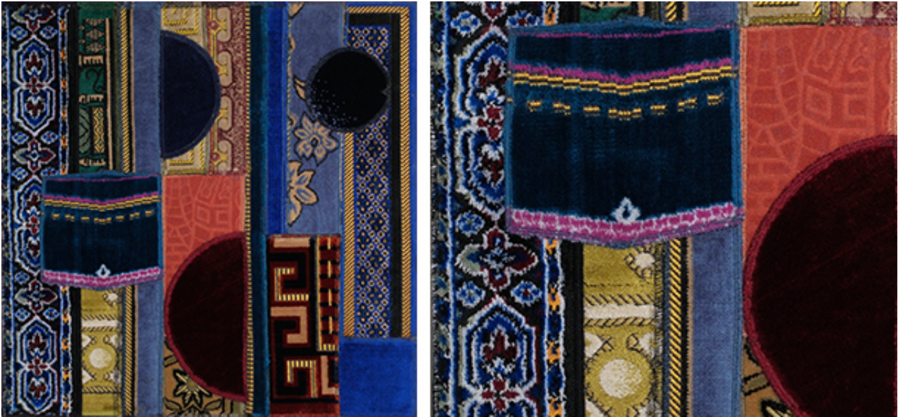
2023-2024, collage with prayer rugs on canvas, 50 x 50 cm.