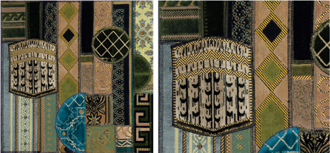
2023-2024, collage with prayer rugs on canvas, 50 x 50 cm.