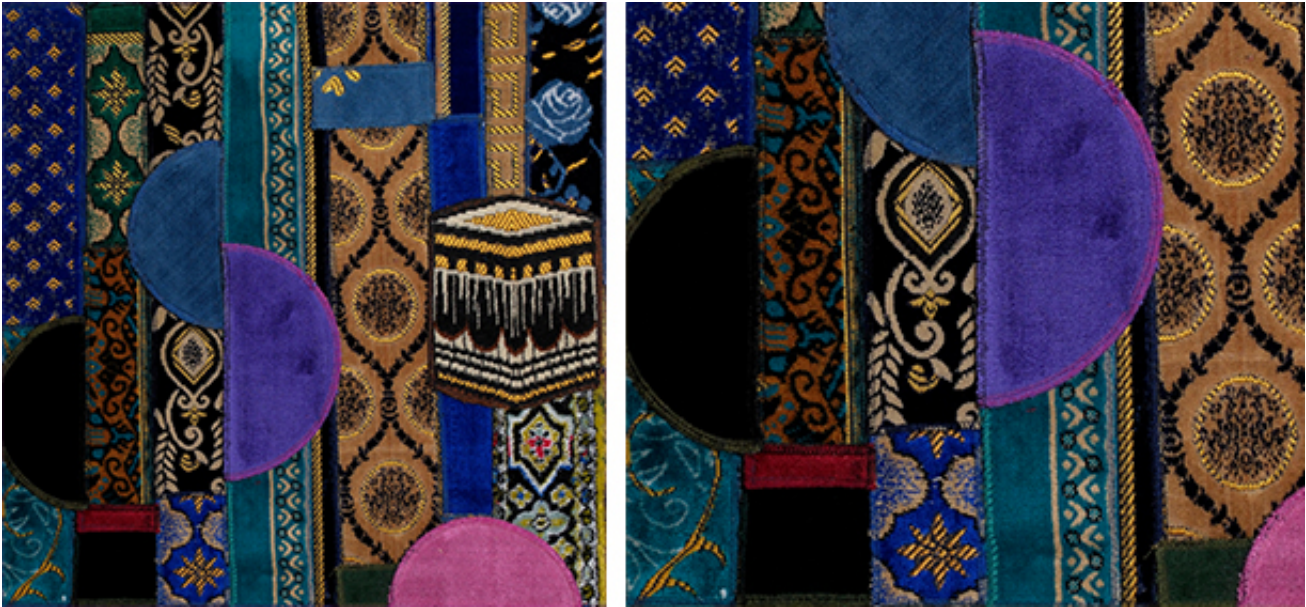
2023-2024, collage with prayer rugs on canvas, 50 x 50 cm. Courtesy of the artist.