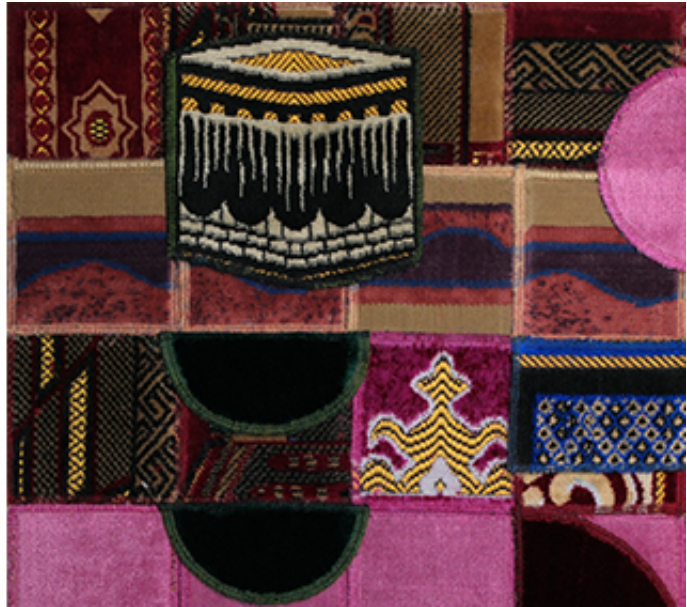
2023-2024, collage with prayer rugs on canvas, 50 x 50 cm.

Dès les VII e et VIII e siècles, les savants islamiques développaient des outils novateurs s'appuyant sur la science, les mathématiques et l'ingénierie. De magnifiques schémas et dessins représentant des roues, engrenages, machines, objets astronomiques ou optiques et pour d'autres usages, accompagnés de leurs textes et annotations, apparaissent dans les exemples les plus anciens de livres et manuscrits de cette époque. Durant cet Âge d'or islamique, ces savants étaient à la pointe de la technologie et de l'innovation, un riche héritage qu'on oublie souvent dans nos sociétés contemporaines. Inspiré en partie par ces images, Mounir Fatmi a commencé à explorer la relation entre la machine, la culture et la religion à travers un corpus d'œuvres comprenant de grandes installations vidéo telles que Temps Modernes et Technologia, et cette série de neuf collages sur toile, œuvres intitulées Mécanisation.