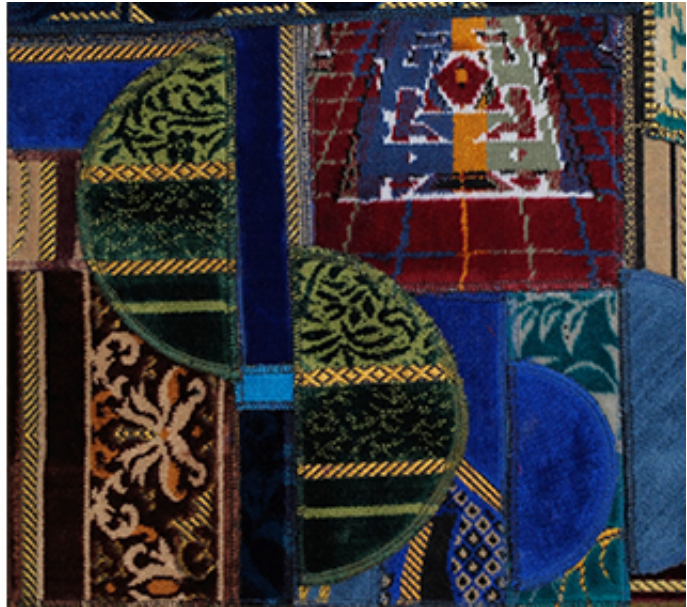
2023-2024, collage with prayer rugs on canvas, 50 x 50 cm. Courtesy of the artist.

Dès les VII e et VIII e siècles, les savants islamiques développaient des outils novateurs s'appuyant sur la science, les mathématiques et l'ingénierie. De magnifiques schémas et dessins représentant des roues, engrenages, machines, objets astronomiques ou optiques et pour d'autres usages, accompagnés de leurs textes et annotations, apparaissent dans les exemples les plus anciens de livres et manuscrits de cette époque. Durant cet Âge d'or islamique, ces savants étaient à la pointe de la technologie et de l'innovation, un riche héritage qu'on oublie souvent dans nos sociétés contemporaines. Inspiré en partie par ces images, Mounir Fatmi a commencé à explorer la relation entre la machine, la culture et la religion à travers un corpus d'œuvres comprenant de grandes installations vidéo telles que Temps Modernes et Technologia, et cette série de neuf collages sur toile, œuvres intitulées Mécanisation.