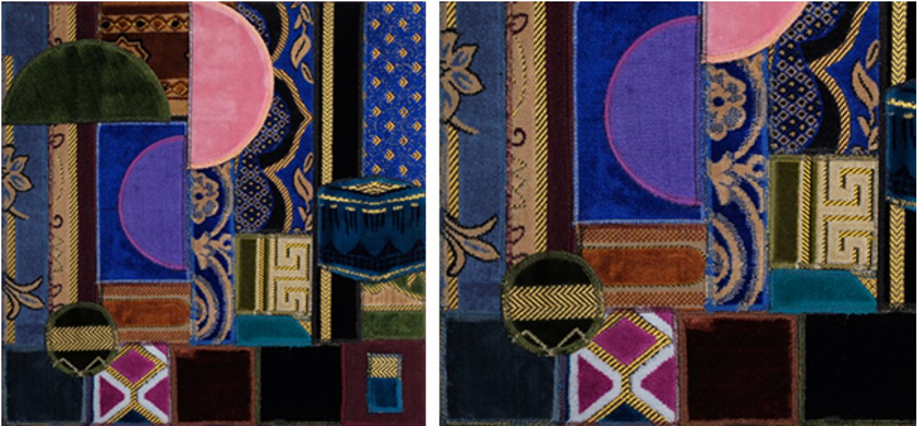
2023-2024, collage with prayer rugs on canvas, 50 x 50 cm. Courtesy of the artist.

Dès les VII e et VIII e siècles, les savants islamiques développaient des outils novateurs s'appuyant sur la science, les mathématiques et l'ingénierie. De magnifiques schémas et dessins représentant des roues, engrenages, machines, objets astronomiques ou optiques et pour d'autres usages, accompagnés de leurs textes et annotations, apparaissent dans les exemples les plus anciens de livres et manuscrits de cette époque. Durant cet Âge d'or islamique, ces savants étaient à la pointe de la technologie et de l'innovation, un riche héritage qu'on oublie souvent dans nos sociétés contemporaines. Inspiré en partie par ces images, Mounir Fatmi a commencé à explorer la relation entre la machine, la culture et la religion à travers un corpus d'œuvres comprenant de grandes installations vidéo telles que Temps Modernes et Technologia, et cette série de neuf collages sur toile, œuvres intitulées Mécanisation.