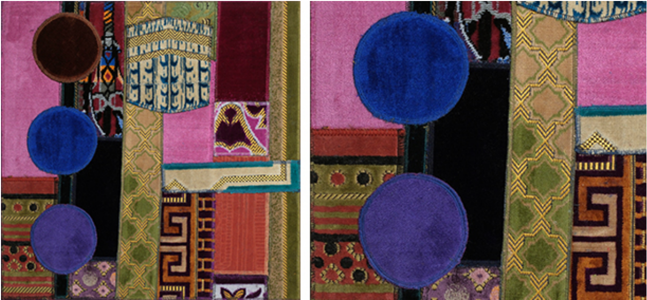
2023-2024, collage with prayer rugs on canvas, 50 x 50 cm. Courtesy of the artist.