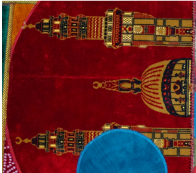
2016, collage with prayer rugs on canvas, diameter 100 cm Courtesy of the artist and Ceysson & Bénétière, Paris.

Dès les VII e et VIII e siècles, les savants islamiques développaient des outils novateurs s'appuyant sur la science, les mathématiques et l'ingénierie. De magnifiques schémas et dessins représentant des roues, engrenages, machines, objets astronomiques ou optiques et pour d'autres usages, accompagnés de leurs textes et annotations, apparaissent dans les exemples les plus anciens de livres et manuscrits de cette époque. Durant cet Âge d'or islamique, ces savants étaient à la pointe de la technologie et de l'innovation, un riche héritage qu'on oublie souvent dans nos sociétés contemporaines. Inspiré en partie par ces images, Mounir Fatmi a commencé à explorer la relation entre la machine, la culture et la religion à travers un corpus d'œuvres comprenant de grandes installations vidéo telles que Temps Modernes et Technologia, et cette série de neuf collages sur toile, œuvres intitulées Mécanisation.