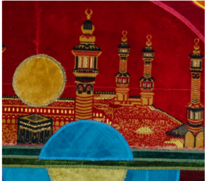
2016, collage with prayer rugs on canvas, diameter 100 cm

Dès les VII e et VIII e siècles, les savants islamiques développaient des outils novateurs s'appuyant sur la science, les mathématiques et l'ingénierie. De magnifiques schémas et dessins représentant des roues, engrenages, machines, objets astronomiques ou optiques et pour d'autres usages, accompagnés de leurs textes et annotations, apparaissent dans les exemples les plus anciens de livres et manuscrits de cette époque. Durant cet Âge d'or islamique, ces savants étaient à la pointe de la technologie et de l'innovation, un riche héritage qu'on oublie souvent dans nos sociétés contemporaines. Inspiré en partie par ces images, Mounir Fatmi a commencé à explorer la relation entre la machine, la culture et la religion à travers un corpus d'œuvres comprenant de grandes installations vidéo telles que Temps Modernes et Technologia, et cette série de neuf collages sur toile, œuvres intitulées Mécanisation.