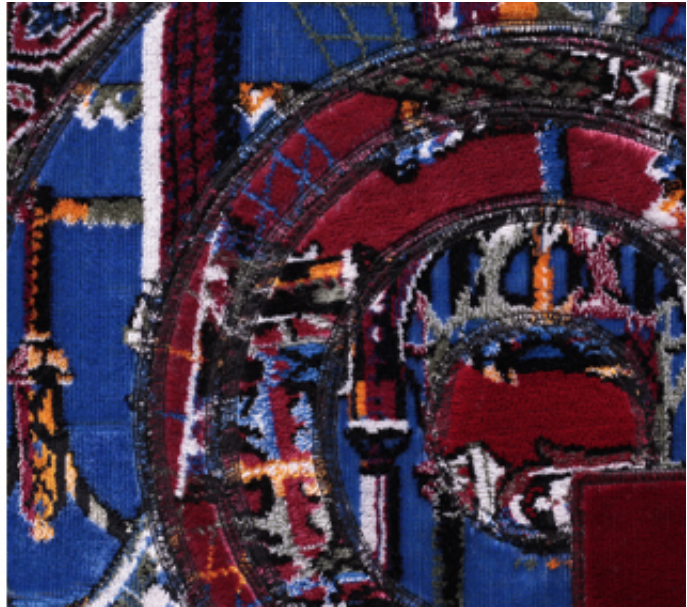
2011, collage with prayer rugs on plywood, 70 cm. Courtesy of the artist and ADN Galeria, Barcelona.

Dès les VII e et VIII e siècles, les savants islamiques développaient des outils novateurs s'appuyant sur la science, les mathématiques et l'ingénierie. De magnifiques schémas et dessins représentant des roues, engrenages, machines, objets astronomiques ou optiques et pour d'autres usages, accompagnés de leurs textes et annotations, apparaissent dans les exemples les plus anciens de livres et manuscrits de cette époque. Durant cet Âge d'or islamique, ces savants étaient à la pointe de la technologie et de l'innovation, un riche héritage qu'on oublie souvent dans nos sociétés contemporaines. Inspiré en partie par ces images, Mounir Fatmi a commencé à explorer la relation entre la machine, la culture et la religion à travers un corpus d'œuvres comprenant de grandes installations vidéo telles que Temps Modernes et Technologia, et cette série de neuf collages sur toile, œuvres intitulées Mécanisation.