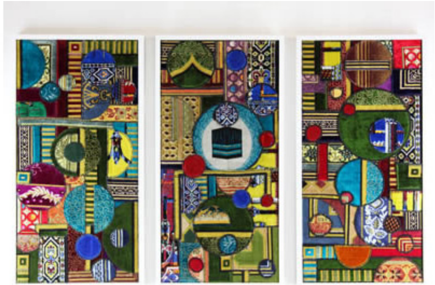
2011, triptych, collage with prayer rugs, 103 x53 cm each. Exhibition view from ARCO, ADN Galeria, 2015, Madrid.

Dès les VII e et VIII e siècles, les savants islamiques développaient des outils novateurs s'appuyant sur la science, les mathématiques et l'ingénierie. De magnifiques schémas et dessins représentant des roues, engrenages, machines, objets astronomiques ou optiques et pour d'autres usages, accompagnés de leurs textes et annotations, apparaissent dans les exemples les plus anciens de livres et manuscrits de cette époque. Durant cet Âge d'or islamique, ces savants étaient à la pointe de la technologie et de l'innovation, un riche héritage qu'on oublie souvent dans nos sociétés contemporaines. Inspiré en partie par ces images, Mounir Fatmi a commencé à explorer la relation entre la machine, la culture et la religion à travers un corpus d'œuvres comprenant de grandes installations vidéo telles que Temps Modernes et Technologia, et cette série de neuf collages sur toile, œuvres intitulées Mécanisation.