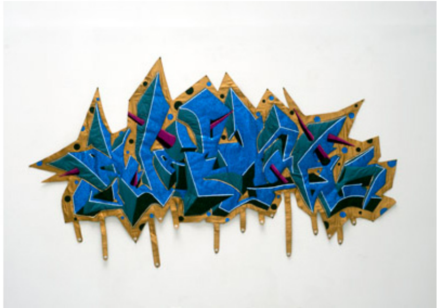
2000-2010, textiles, 145 x 300 cm.

Divin Graffiti, Al Jabbar, 2010, est un collage mural suspendu de grande taille composé de tissus bleus, gris, roses, jaunes et verts qui ont été coupés et cousus ensemble pour former le nom Al Jabbar, l'un des 99 noms donnés à Allah dans l'islam. L'écriture n'est pas calligraphique ni formelle, ce qui est l'usage lorsqu'on écrit le nom de dieu, prenant au lieu de cela la forme d'un graffiti aussi coloré qu'effronté.