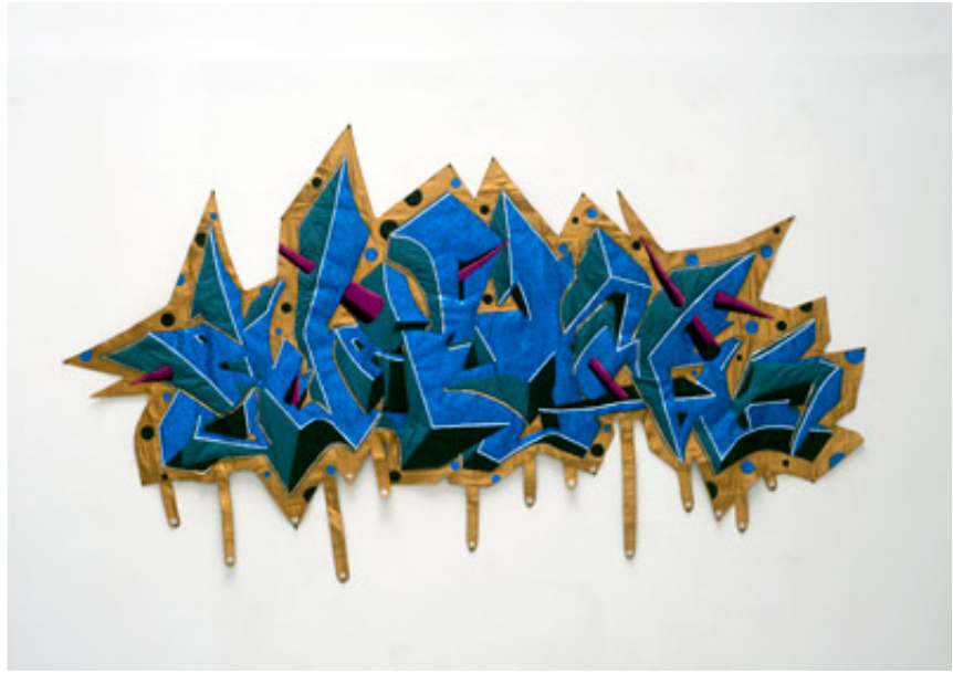
2000-2010, textiles, 145 x 300 cm.

Divin Graffiti, Al Jabbar, 2010, est un collage mural suspendu de grande taille composé de tissus bleus, gris, roses, jaunes et verts qui ont été coupés et cousus ensemble pour former le nom Al Jabbar, l'un des 99 noms donnés à Allah dans l'islam. L'écriture n'est pas calligraphique ni formelle, ce qui est l'usage lorsqu'on écrit le nom de dieu, prenant au lieu de cela la forme d'un graffiti aussi coloré qu'effronté.