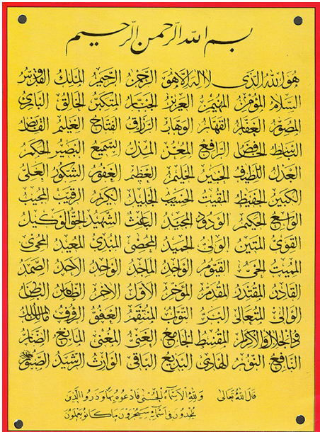
Face - 99 names of God

In this piece, the public is confronted with 99 conference badges inscribed with these evocative names. Thus, through a subtle sleight of hand, the spectator conjures up an image of God, images that are surely even richer than if God had been pictured.