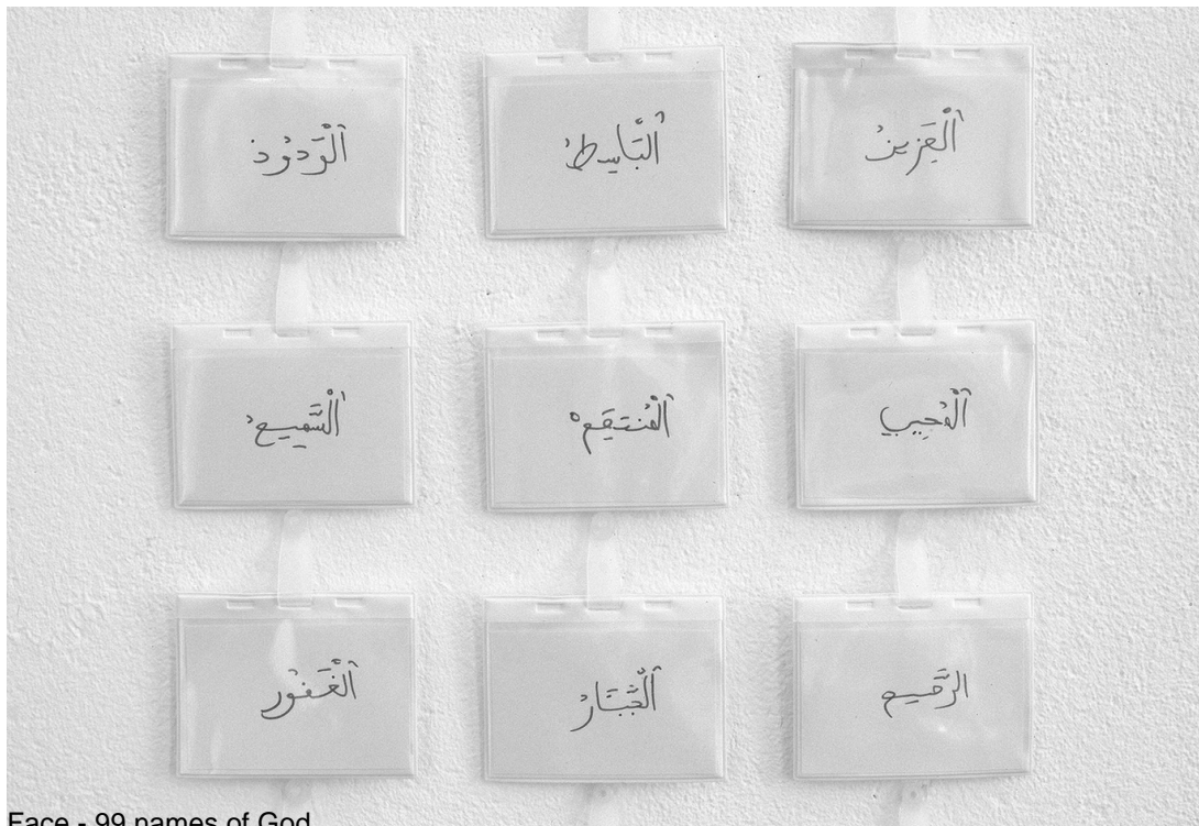
Face - 99 names of God

In this piece, the public is confronted with 99 conference badges inscribed with these evocative names. Thus, through a subtle sleight of hand, the spectator conjures up an image of God, images that are surely even richer than if God had been pictured.