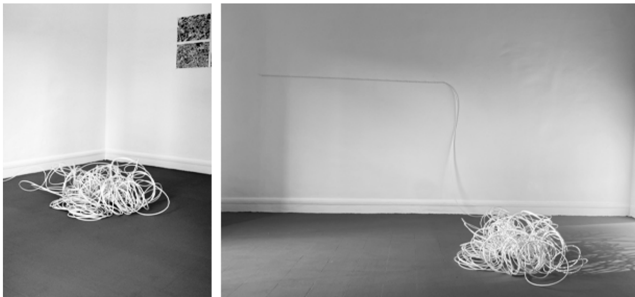
100 mètres à vol d'oiseau. 2023, 100 meters white coaxial cable. Exhibition view from 100 mètres à vol d'oiseau, L'appartement 22, 2023, Rabat.

La série À Vol d'Oiseau s'efforce d'établir un lien visuel entre l'espace d'exposition, où l'artiste présente ses œuvres, et les lieux politiques les plus proches, tel que les parlements, les tribunaux, les mairies ou les bâtiments administratifs. L'artiste se sert de vues aériennes et puise son inspiration dans les cartes de la ville ainsi que dans des outils numériques tels que Google Maps and Google Earth. Au cœur de ce voyage visuel, des questionnements émergent, explorant la relation symbiotique entre l'art et la politique, repoussant les frontières conventionnelles et encourageant une réflexion sur leur influence réciproque.