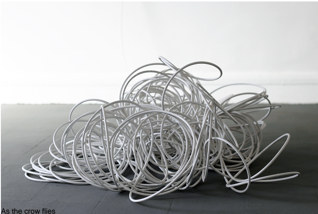
As the crow flies

The artist compels us to ponder fundamental questions: What is an artistic proposal? and What is a political proposal? Are they really so distant from each other? And can one influence the other?