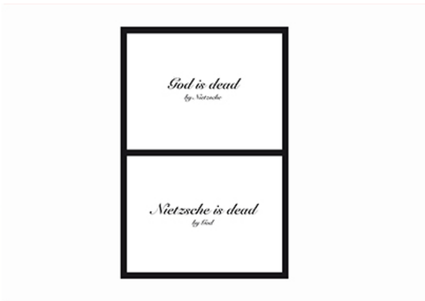
2012, Silk print on paper, 60 x 40 cm.