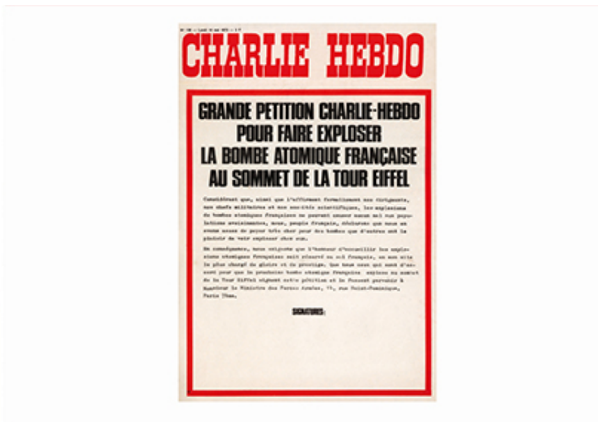
2009, Inkjet Print, 39,5 x 27,5 cm. Ed. of 50 + 1 A.P.