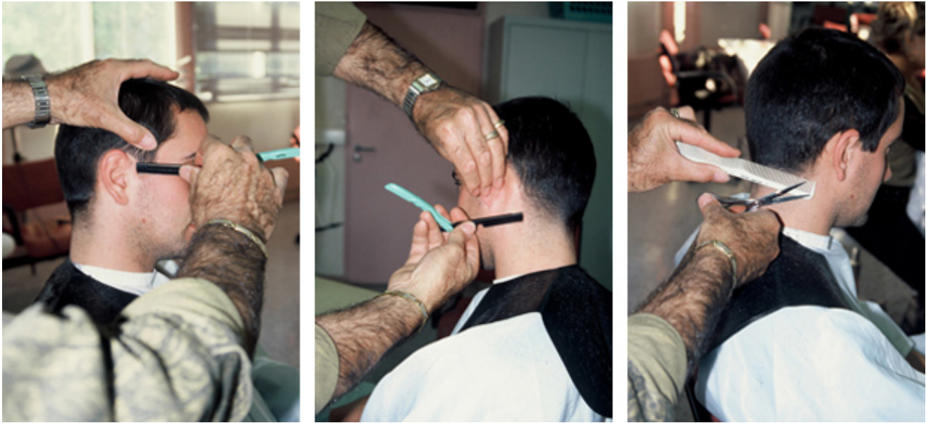
2000, triptych. Exhibition view from Ovalprojet, CAC Le Chaplin, 2002, Mantes-la-Jolie. Ed. of 5 + 2 A.P.

« Coupe carrée » est un work in progress photographique initié en 2000 dont la genèse s'organise autour d'une figure géométrique, le carré. Le carré ou le cube sont des formes récurrentes dans les œuvres de mounir fatmi, où elles sont notamment utilisées dans diverses représentations de la Kaaba, lieu de culte musulman, et entrent dans diverses expérimentations géométriques. Le carré ne symbolise pas seulement les dogmes de la religion, il est également une figure qui rend compte de son fonctionnement et qui permet d'explorer le rapport du croyant à la religion à travers les rituels et les objets de culte. La religion et les croyances sont du thème fréquemment traité dans les œuvres de mounir fatmi, dont l'étude, inspiré des différents courants artistiques est menée à travers différents médias, peintures, sculptures et installations. Chacune de ces œuvres s'attache à observer et reproduire des fonctionnements afin d'en faire prendre conscience au spectateur. Le carré est ainsi envisagé comme une structure qui impose une attitude physique et spirituelle au croyant. Il est également une forme à l'esthétique pleine de séductions, de mystères et d'interdits, qui en impose au spectateur en fixant strictement ses limites à angles droits.