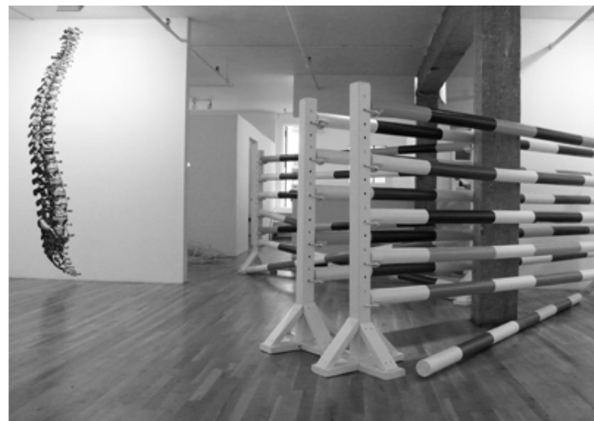
Fuck Architects: Chapter 1, mounir fatmi, SF Publishing, 2021