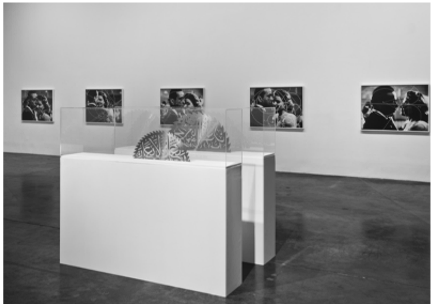
Kissing Circles, mounir fatmi, SF Publishing, 2020