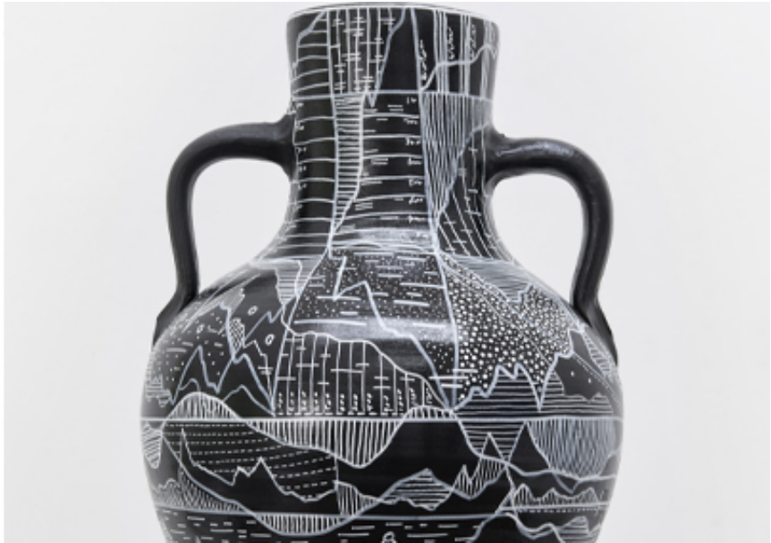
2022, Acrylic on ceramic, H 43,5 cm. Exhibition view from The Point of No Return , Wilde Gallery, 2022, Basel.