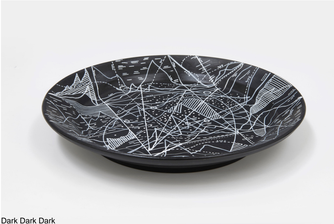
Dark Dark Dark

The jar, which represents one of the first supports for transporting and storing different liquids such as water, and the plate, which represents our relationship to food and therefore to the energy that allows us to continue living. Sculpture then brings together the concept of the medium and the archive at the same time.