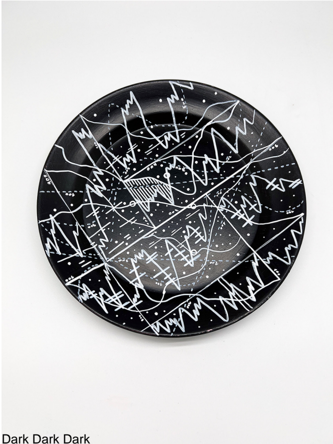
Dark Dark Dark

The artist asks himself several questions: what is necessary to preserve? What should we do with these archives? What will happen when all this data becomes obsolete? How to preserve this information when our archiving technology is obsolete?