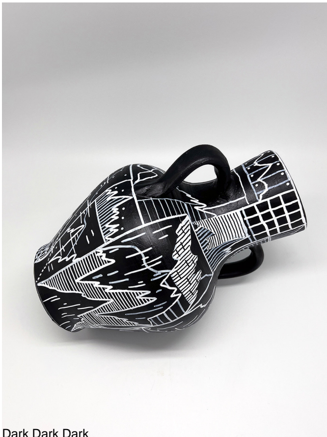
Dark Dark Dark

These ceramic sculptures function as artefacts or archives, loaded with information. They are crossed horizontally by lines of curved inflections and graphs resulting from mathematical algorithms and economic sciences to produce a visual representation of our numerical data. In other words, the artist links this mass of incomprehensible data to the reality of our daily lives.