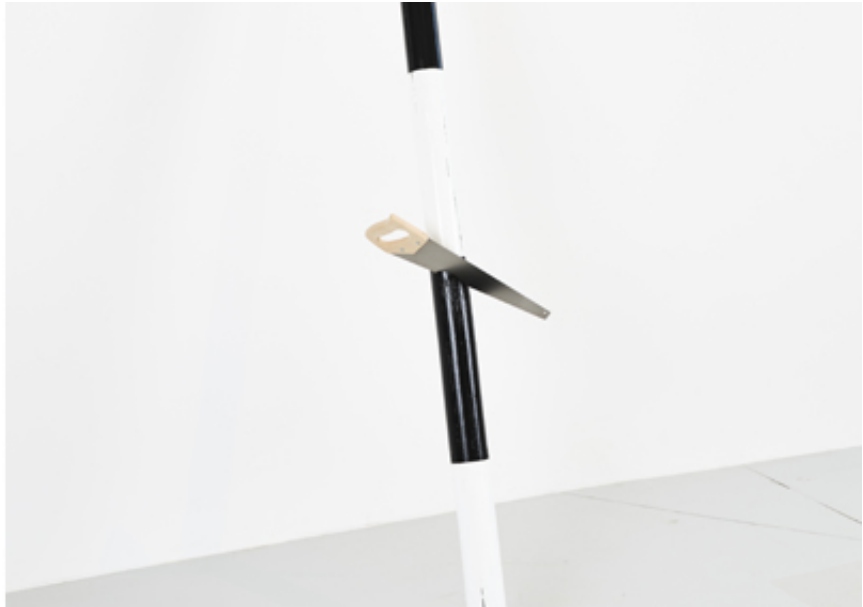
2022, Black and white wood bar and saw. 350 x 40 x 106,5 cm. Exhibition view from How much is enough, Ceysson & Bénétière, 2022, Saint-Etienne.

La sculpture How Much is Enough est composée d'une barre d'obstacle de chevaux et d'une scie. Ici nous assistons symboliquement à une chute brutale d'arbres, à une scène de violence commise par l'homme. Ce spectacle prend en compte l'idée que plus on crée, plus cela conduit à un surplus. Mais qu'est-ce que le surplus exactement ? Qu'est-ce que notre société en fait ? Et combien est-ce suffisant ?