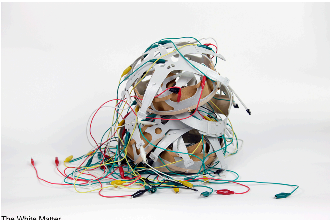
The White Matter

Marshall McLuhan, The Medium is The Message, 1967