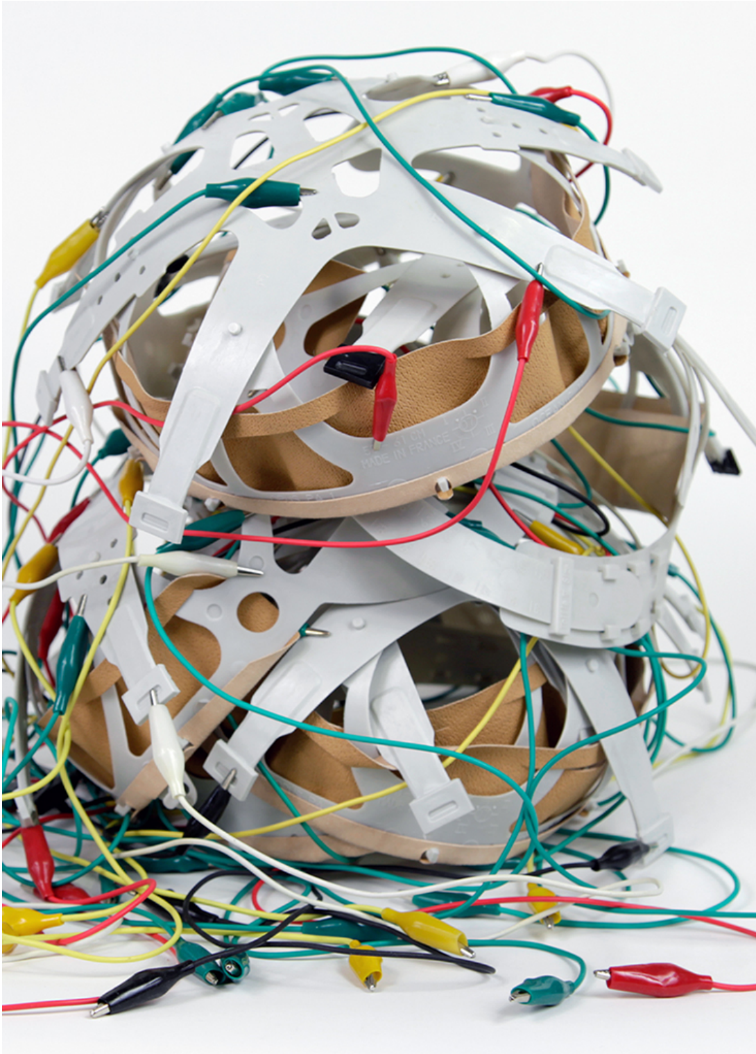
The White Matter

The sculpture The White Matter is a warning against the very real risk of dehumanization, progressively yielding decision-making to information and communication technologies. Lastly, it reaffirms artistic exploration despite this worrying acceleration of technology and its uncertainties.