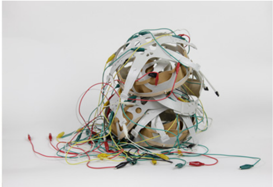
2019, hard hat interiors, cables, pedestal and glass case, 25 x 22 x 20cm. Ed. of 5 + 1 A.P.

This work was part of Biennale d'art contemporain Hybride - Ouvrir, Lens, 2021.