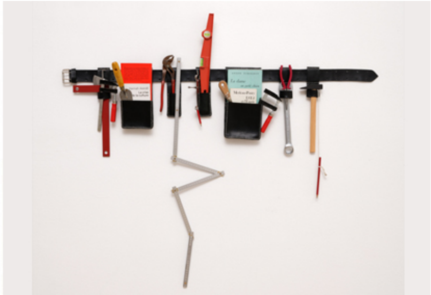
2019, black leather tool belt, construction tools and books, 114 x 130 cm. Exhibition view from The White Matter, Ceysson & Bénétière, 2019, Paris.

La sculpture « Tools Holder 01 » est réalisée à l'aide d'une ceinture à outils en cuir noir déroulée et accrochée au mur. À celle-ci sont suspendus divers instruments de bricolage (spatule, pince, niveau à bulle, marteau crayon, etc.), mais également des ouvrages philosophiques, La Crise de la culture d'Hannah Arendt, L'Œil et l'Esprit , de Merleau-Ponty, La Philosophie critique de Kant , de Deleuze ainsi qu'une œuvre littéraire, La Dame au petit chien , d'Anton Tchekhov.