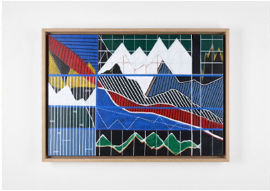
2019, Acrylic on canvas, 38 x 55 cm.

Depuis le début de sa recherche artistique, mounir fatmi s'est inspiré des signes et des formes calligraphiques arabes. La découverte des peintures de Brion Gysin à Tanger dans les années 80, lui a permis de voir ces dernières sous un autre angle, celui d'un langage universel. En 2014, il associe à ces formes calligraphiques d'autres dessins géométriques inspirés cette fois des courbes de la bourse. Il découvre ainsi cet alphabet abstrait et complexe qui constitue le langage économique. Il commence alors la série de dessins et de peintures, « Calligraphies de l'inconnu ». Déclarant : "Pour comprendre le monde, il faut prendre le pouls des marchés financiers, mais aussi des marchés aux puces."