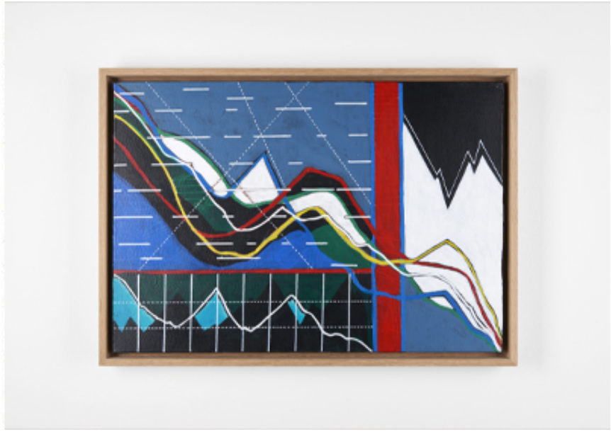
2019, Acrylic on canvas, 38 x 55 cm.

Depuis le début de sa recherche artistique, mounir fatmi s'est inspiré des signes et des formes calligraphiques arabes. La découverte des peintures de Brion Gysin à Tanger dans les années 80, lui a permis de voir ces dernières sous un autre angle, celui d'un langage universel. En 2014, il associe à ces formes calligraphiques d'autres dessins géométriques inspirés cette fois des courbes de la bourse. Il découvre ainsi cet alphabet abstrait et complexe qui constitue le langage économique. Il commence alors la série de dessins et de peintures, « Calligraphies de l'inconnu ». Déclarant : "Pour comprendre le monde, il faut prendre le pouls des marchés financiers, mais aussi des marchés aux puces."