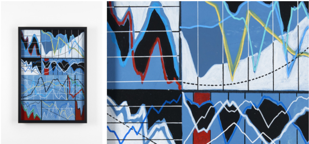
2020-2021, acrylic on paper, 50 x 35 cm. Courtesy of the artist.