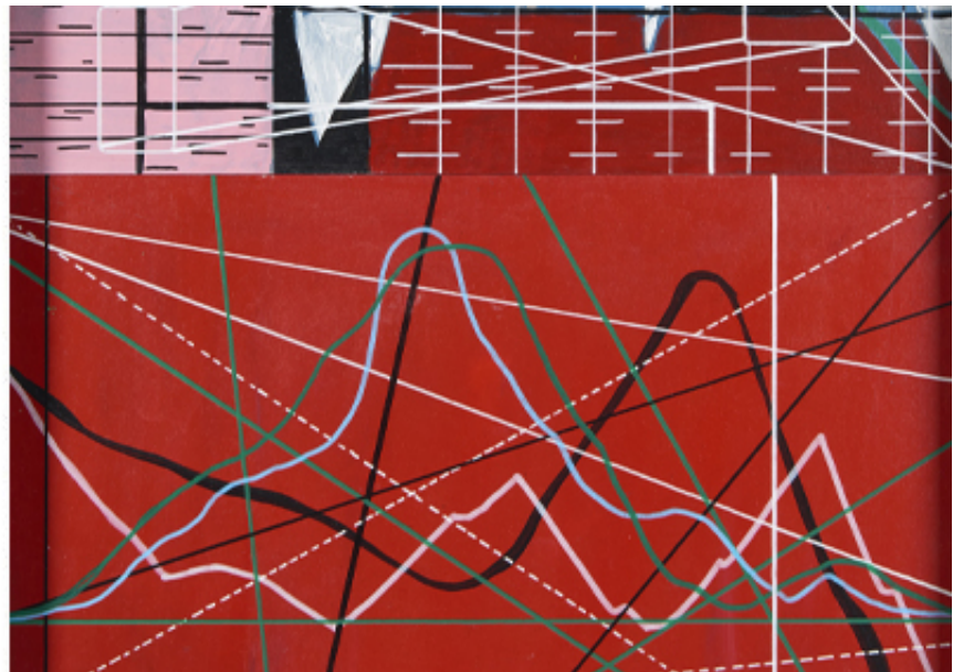
2020-2021, acrylic on paper, 50 x 35 cm.

Depuis le début de sa recherche artistique, mounir fatmi s'est inspiré des signes et des formes calligraphiques arabes. La découverte des peintures de Brion Gysin à Tanger dans les années 80, lui a permis de voir ces dernières sous un autre angle, celui d'un langage universel. En 2014, il associe à ces formes calligraphiques d'autres dessins géométriques inspirés cette fois des courbes de la bourse. Il découvre ainsi cet alphabet abstrait et complexe qui constitue le langage économique. Il commence alors la série de dessins et de peintures, « Calligraphies de l'inconnu ». Déclarant : "Pour comprendre le monde, il faut prendre le pouls des marchés financiers, mais aussi des marchés aux puces."