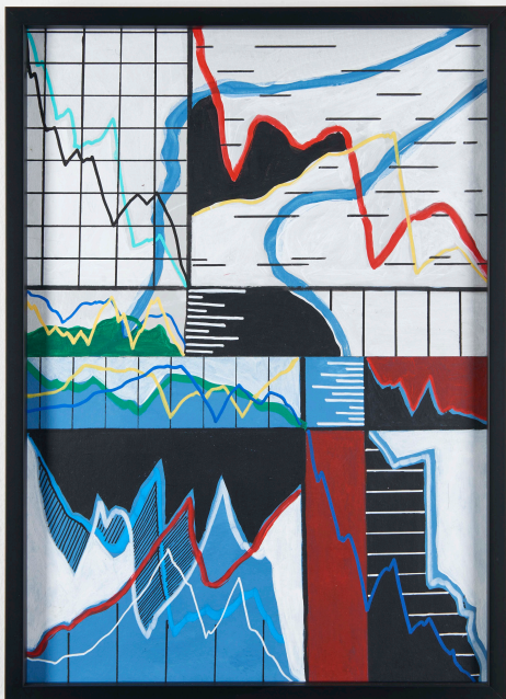
Calligraphy of the unknown

The color palette of these paintings is often limited to the primary colors, evocative of computer monitors such as the ones showing stock exchange prices that have been relating their fluctuations since the advent of information technology in the 1970s.