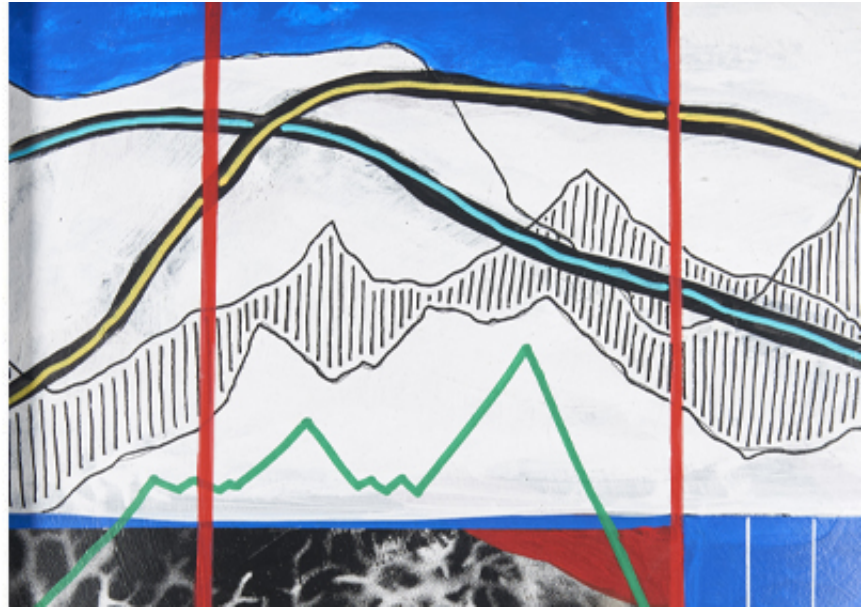
2020-2021, acrylic on paper, 50 x 35 cm.