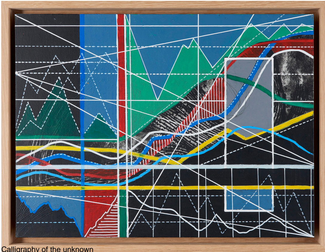
Calligraphy of the unknown

Painted with acrylic on a black or white rectangular background, Calligraphies of the Unknown are crossed horizontally with lines forming rounded curves or sharp peaks. These colored lines give the paintings the aspect of graphics derived from mathematical algorithms created to visually represent data sets of numbers.