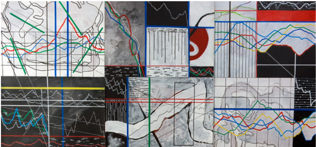
2018-2020, acrylic on paper, 105 x 50 cm. Courtesy of the artist and BARO galeria, Palma.

Depuis le début de sa recherche artistique, mounir fatmi s'est inspiré des signes et des formes calligraphiques arabes. La découverte des peintures de Brion Gysin à Tanger dans les années 80, lui a permis de voir ces dernières sous un autre angle, celui d'un langage universel. En 2014, il associe à ces formes calligraphiques d'autres dessins géométriques inspirés cette fois des courbes de la bourse. Il découvre ainsi cet alphabet abstrait et complexe qui constitue le langage économique. Il commence alors la série de dessins et de peintures, « Calligraphies de l'inconnu ». Déclarant : "Pour comprendre le monde, il faut prendre le pouls des marchés financiers, mais aussi des marchés aux puces."