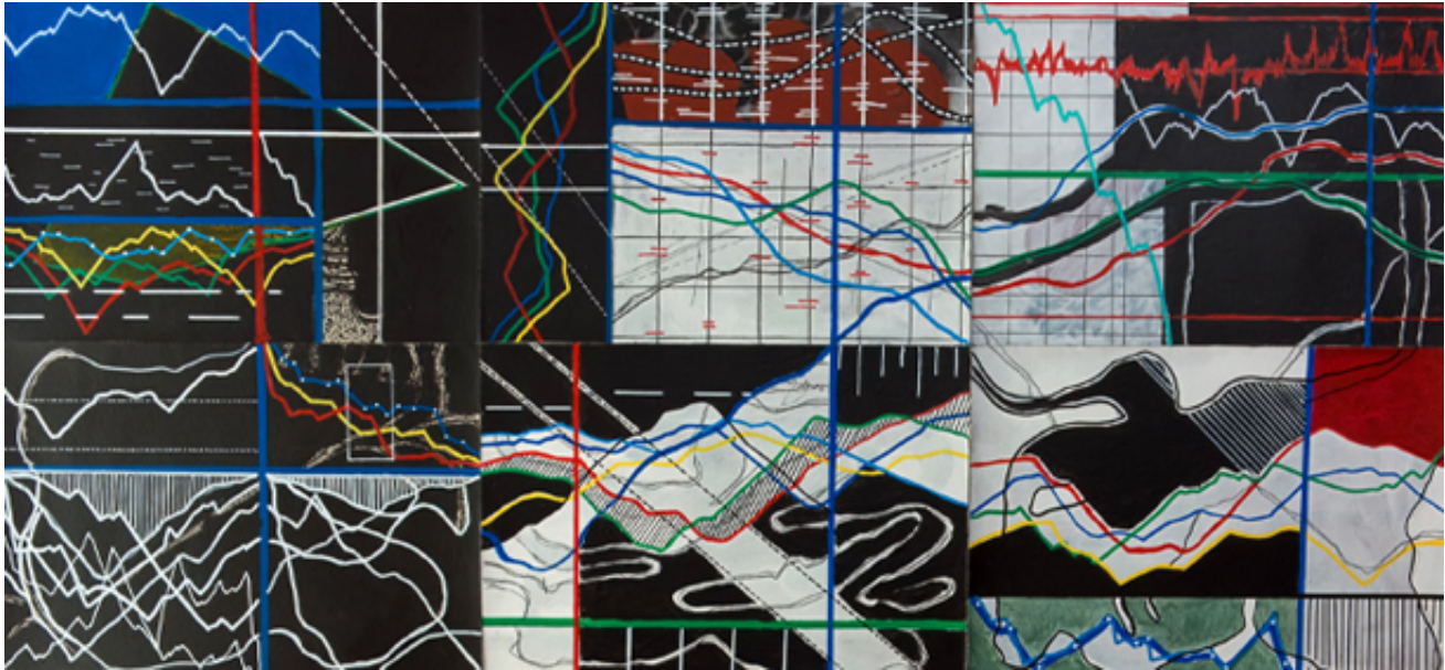
2018-2020, acrylic on paper, 105 x 50 cm.