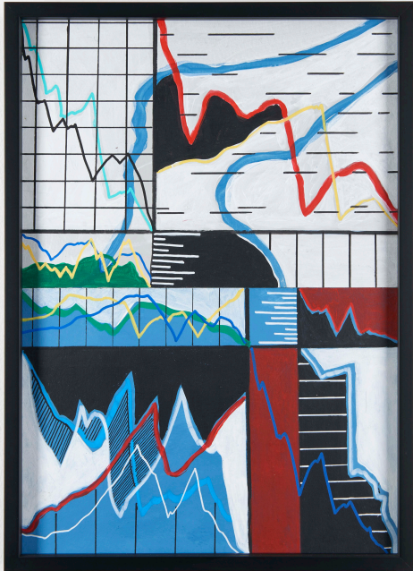
Calligraphy of the unknown

The color palette of these paintings is often limited to the primary colors, evocative of computer monitors such as the ones showing stock exchange prices that have been relating their fluctuations since the advent of information technology in the 1970s.