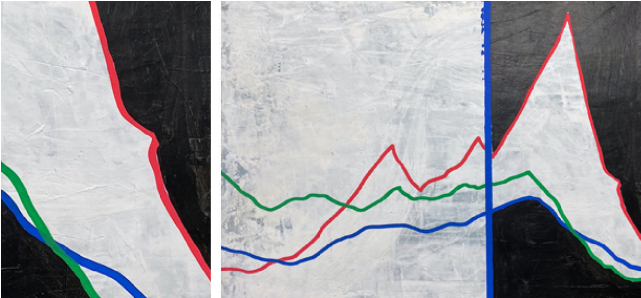
Series started in 2014, acrylic on paper, 30 x 40 cm.

Depuis le début de sa recherche artistique, mounir fatmi s'est inspiré des signes et des formes calligraphiques arabes. La découverte des peintures de Brion Gysin à Tanger dans les années 80, lui a permis de voir ces dernières sous un autre angle, celui d'un langage universel. En 2014, il associe à ces formes calligraphiques d'autres dessins géométriques inspirés cette fois des courbes de la bourse. Il découvre ainsi cet alphabet abstrait et complexe qui constitue le langage économique. Il commence alors la série de dessins et de peintures, « Calligraphies de l'inconnu ». Déclarant : "Pour comprendre le monde, il faut prendre le pouls des marchés financiers, mais aussi des marchés aux puces."